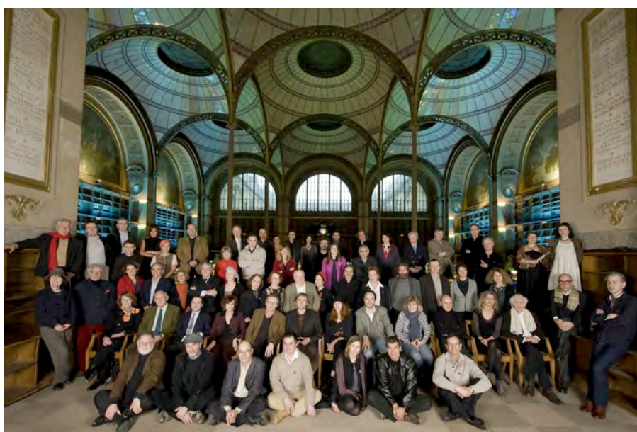
Les écrivains du Comité de soutien posent pour une photo à la Bibliothèque nationale de France à l’occasion des 10 ans de Lire et faire lire (janvier 2010)